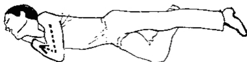
Ilustrace 2: uložení postiženého do stabilizované polohy