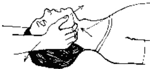
Ilustrace 1: uvolnění dýchacích cest - trojitý záklon hlavy (tzv. Esmarchův manévr)